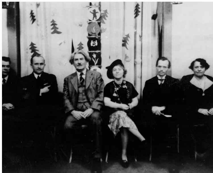
Zostavil: Pixel', 49. zbor Geronimo